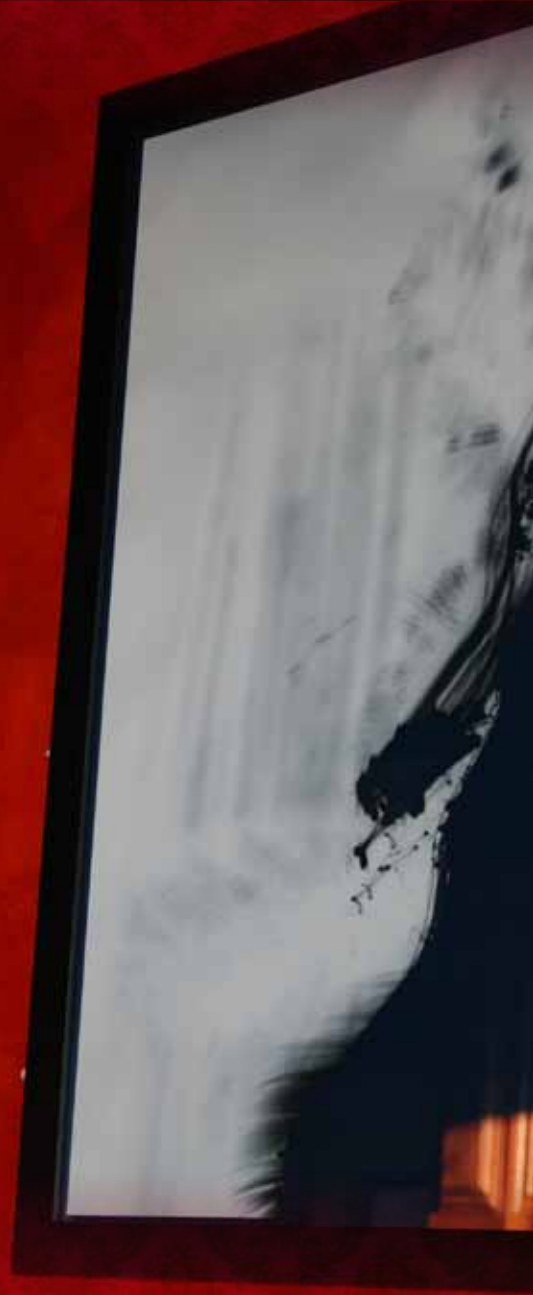
Small, illegible text label positioned below the left photograph.